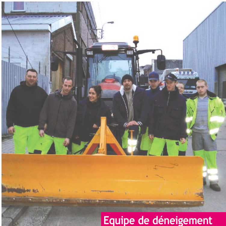
Equipe de déneigement des espaces publics

Au nom des habitants de la commune de Dison, je tiens à leur témoigner notre profonde gratitude.